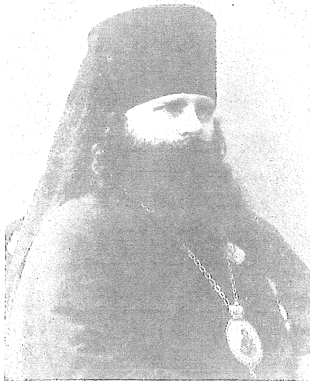
ЕПИСКОП ИННОКЕНТИЙ (ПУСТЫНСКИЙ)