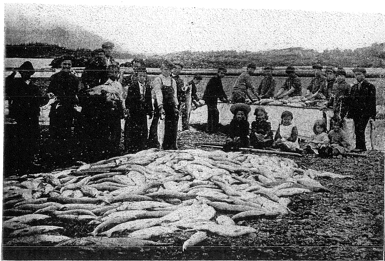
Ситкинские воспитанники на рыбной ловле в 1907 году