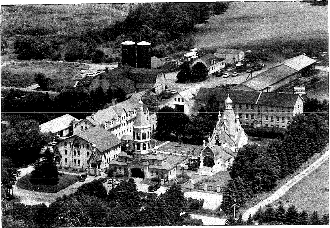
СВЯТО ТРОИЦКИЙ МОНАСТЫРЬ В ДЖОРДАНВИЛЛЕ