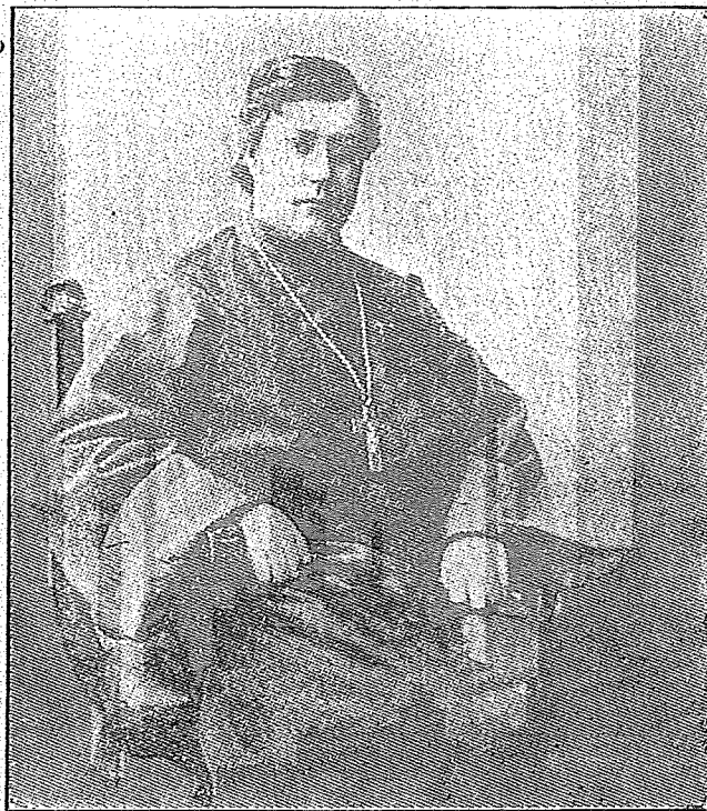
ПРОТОИЕРЕЙ ИОАНН КОЧУРОВ