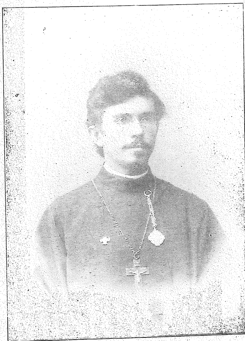
ПРОТОИЕРЕИ АЛЕКСАНДР ХОТОВИЦКИЙ