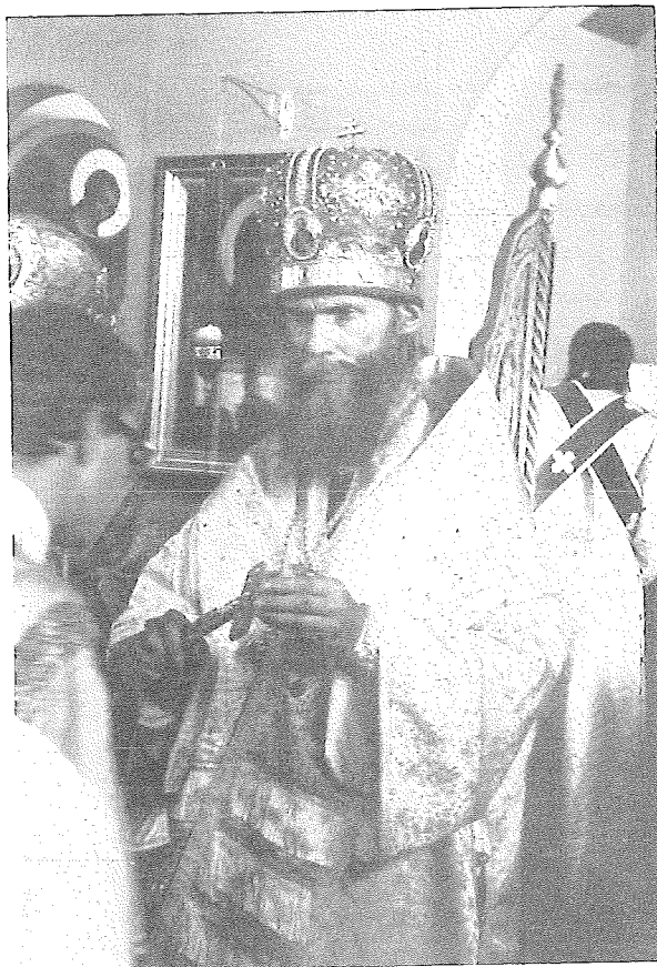
СВЯТОЙ МИТРОПОЛИТ ФИЛАРЕТ (ВОЗНЕСЕНСКИЙ) ПЕРВОСВЯТИТЕЛЬ РПЦЗ