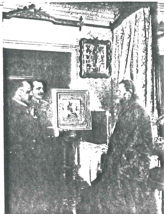
Святой Иоанн Кронштадский, благословивший сбор на построение храма в Нью-Йорке, принимает в подарок икону Св. Георгия от С. Петербургской газеты

Скоро ли судит Господь довести святое дело построения православного храма в Нью-Йорке до конца? - Впереди много расходов. При самой скромной архитектуре постройка обойдется не менее 50 тысяч долларов. Верим, что Господь, не посрамивший упования нашего раньше, продолжит милости Свои к нам. Щедрое содействие Святейшего Синода даст возможность безбоязненно приступить к построению храма. Остальное довершит щедрая лепта русского человека, который не откажет в сочувствии своим далеким землякам. С верою в доброе русское сердце и отзывчивую душу своих дорогих соотечественников и единоверцев обращаем мы к ним наш усердный призыв: будьте участниками начатого святого дела! Богатые от щедрот своих, бедные от скудости своей - помогите! За доброе дело Бог воздаст вам добром.